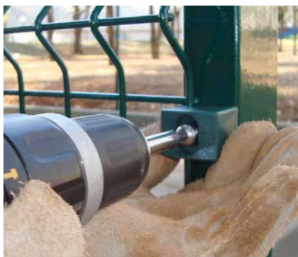
Retire o parafuso.