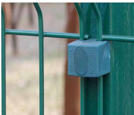
Retire a tampa do fixador de Nylon.

Antes de fazer a substituição, tenha em mente que, após instalado, este parafuso não mais poderá ser retirado. Portanto, para evitar a movimentação dos painéis faça a substituição de 1 fixador por vez, da seguinte forma: