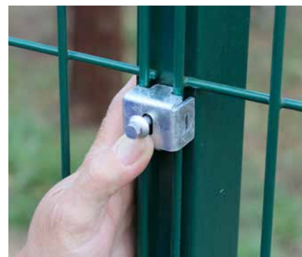
Posicione o fixador de segurança no porte.